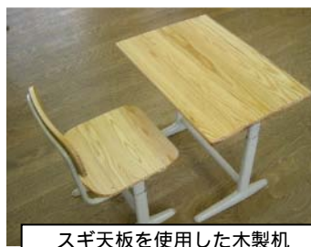
スギ天板を使用した木製机