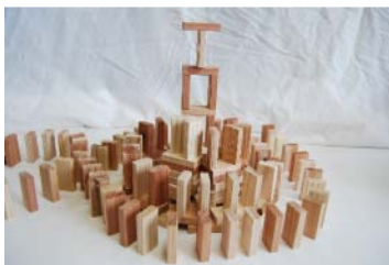
スギを使用した木製積木